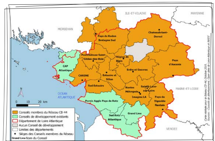
PÉRIMÈTRE DES CONSEILS DE DÉVELOPPEMENT EN LOIRE-ATLANTIQUE

Il regroupe 13 Conseils de développement : CARENE, Châteaubriant-Derval, Erdre et Gesvres, Estuaire et Sillon, Imagine LA, Nantes Métropole, Pays d'Ancenis, Pays de Redon Bretagne Sud, Pays du Vignoble Nantais, Pontchâteau-Saint-Gildas-des-Bois, Région de Blain, Sainte Luce-sur-Loire, et Sud Estuaire.