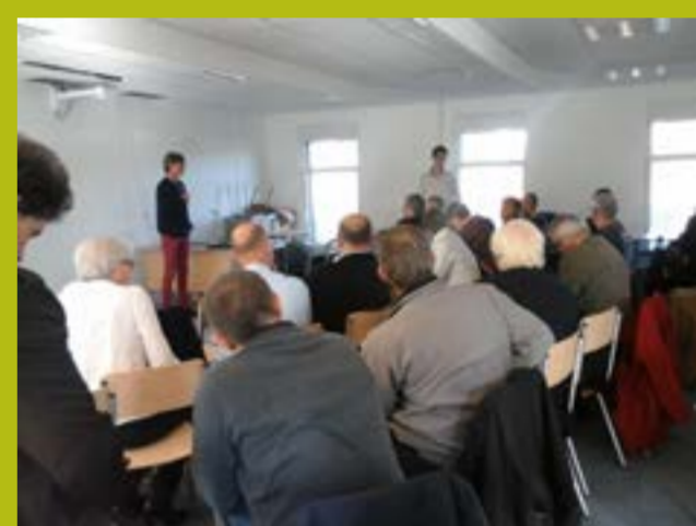
Matinée témoignages d'agriculteurs du Pays de Redon

A l'auditorium de la Maison de l'Economie sociale et solidaire, 15 rue Martenot à Rennes.