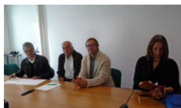
Signature de la convention de partenariat avec la CADES